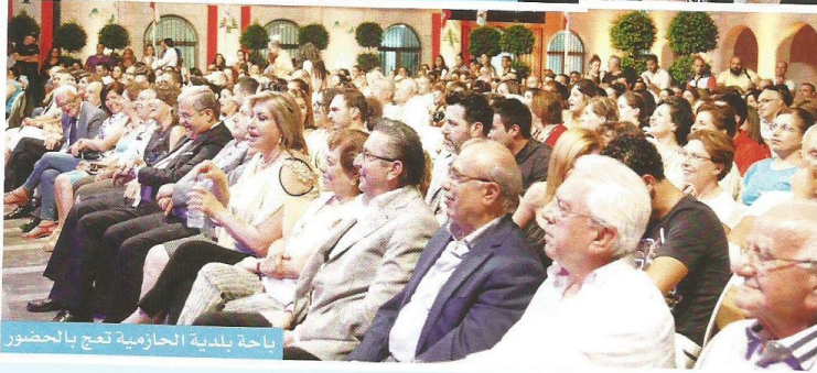
باحة بلدية الحازمية تعج بالحضور