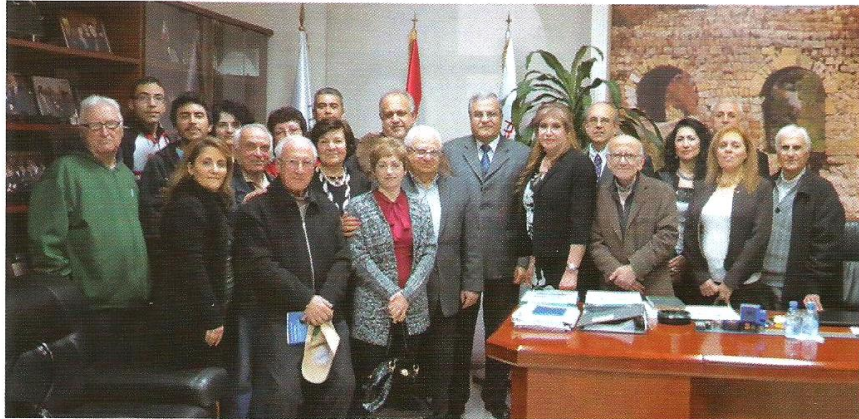
الوفد الأرمني يهنئ الرئيس

كذلك تحضر بلدية الحازمية لمؤتمر ضخم يضم شباب البلدة ايماناً منها بضرورة الوقوف عند رأي عنصر الشباب واتخاذ القرارات التي تزيد من انتمائهم لبلدتهم.