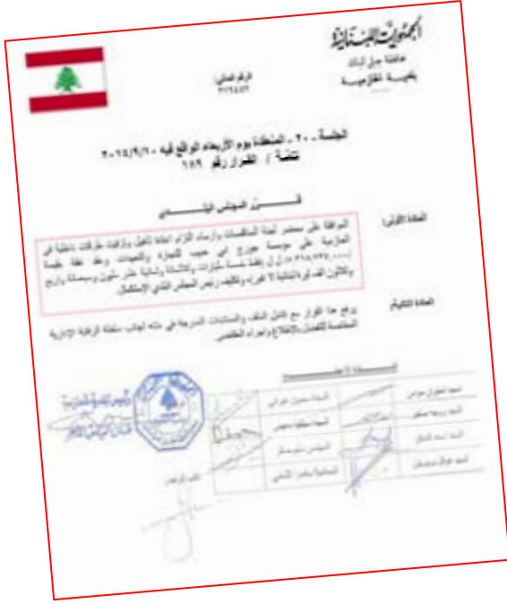
نص القرار رقم ٢٠١٤/١٨٩

بتاريخ ٢٠١٤/٩/١٠، اتخذ المجلس البلدي القرار رقم ١٨٩ القاضي بالموافقة على ارساء التزام اعادة تأهيل وتزفيت طرق الحازمية على مؤسسة جورج ابي حبيب بمبلغ وقدره ٥.٣١٨.٧٤٣.٠٠٠ ل ل (خمسة مليارات وثلاثمائة وثمانية عشر مليون وسبعمائة وثلاثة واربعون الف ليرة لبنانية)، وقد أقر المجلس البلدي تكليف شركة متخصصة لمتابعة دراسة وتنفيذ مشروع تزفيت كامل لطرق الحازمية على مرحلتين خلال عامي ٢٠١٤ و ٢٠١٥ على ان يشمل المشروع انشاء الأرصفة حيث أمكن وتزبيح الطرق ووضع المسامير الفوسفورية.