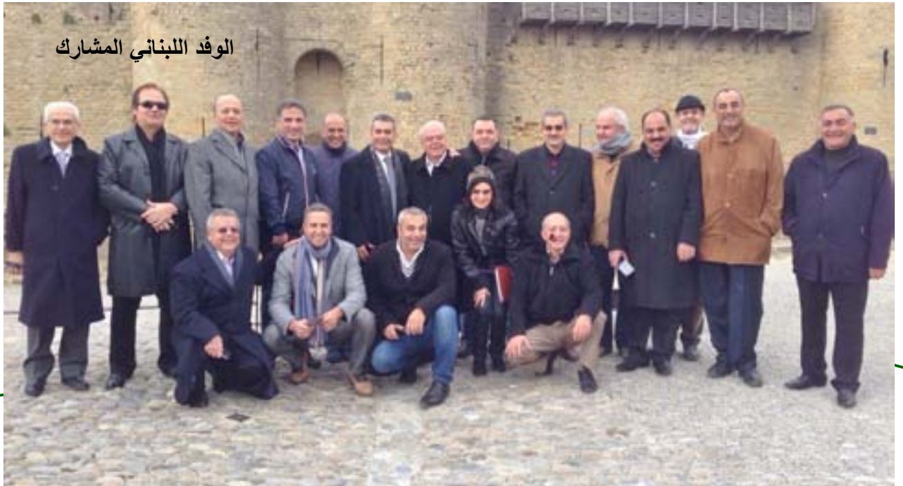
الوفد اللبناني المشارك

تخلّل المؤتمر زيارت تقنية الى بلدية Narbonne (دار الشباب والثقافة)، بلدية Lézignan-Corbières (عرض للمشاريع الاقتصادية والاجتماعية وعرض لمشروع يضم ٣٠ بلدية وكيفية التنسيق في ما بينها)، زيارة الى مصنع لجمع طائرات Airbus في مدينة Toulouse، بلدة Blagnac. تكلّلت زيارتنا بحضور معالي الوزيرة Annick GIRARDIN (المكلفة بشؤون التنمية والتعاون) والسيد André VIOLA (رئيس مقاطعة أود الفرنسية).