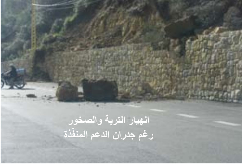
انهيار التربة والصخور رغم جدران الدعم المنفذة