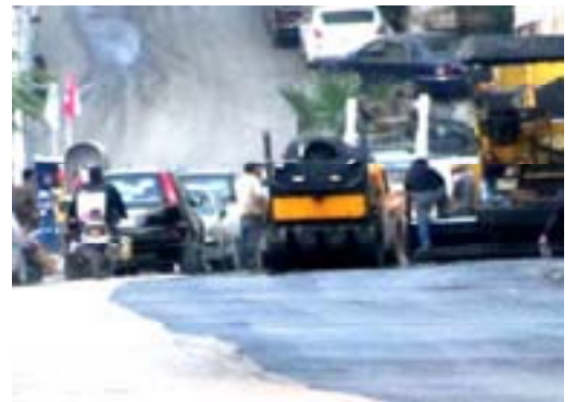
نقل الرئيس مكتبه الى طرق الحازمية ليشرف بشكل مباشر على عملية التزفيت