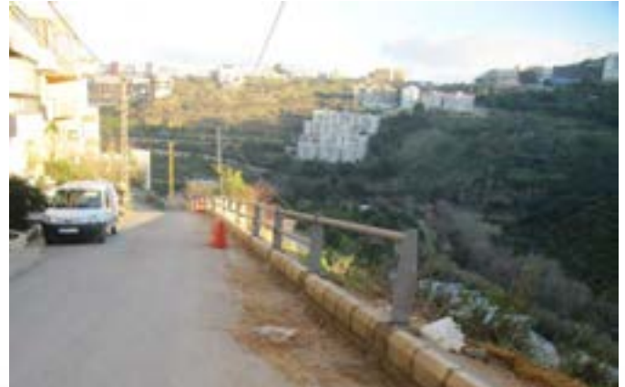
درايزين ٩٠ م خلف كنيسة القيامة - نيو مارت تقلا

تصنيع وتركيب درايزين طريق من أرجل (وقافات) من حديد صفائح سماكة ١٠ ملم وفلنشة (مسطحات) سفلية مزدوجة واحدة ثابتة بالإسمنت مع براغي وأخرى ملحمة بأسفل رجل الدرايزين تصنيع وتركيب عوارض من قساطل ٣ انش - ٩ سنتم أسود سميك عدد ٢ متوازية وملحمة على الأرجل من الأعلى والمنصف كل ثلاثة امتار دهان اساس epoxy ودهان نهائي لون اخضر