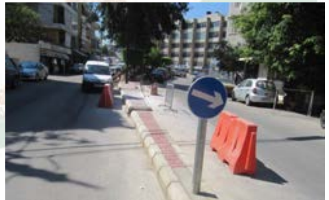
انشاء قاطع وسطي طول ٣٥ متر وعرض وسطي ١.٢٥ م في ساحة الشهداء - الحازمية