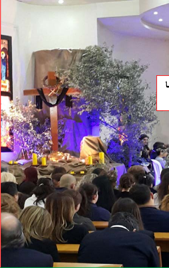
رعية مارت تفلأ الحازمية: هوشعنا الآتي باسم الرب