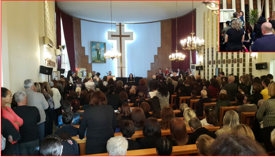
كنيسة مار الياس: بيت الضيق يتسع لألف صديق ومؤمن