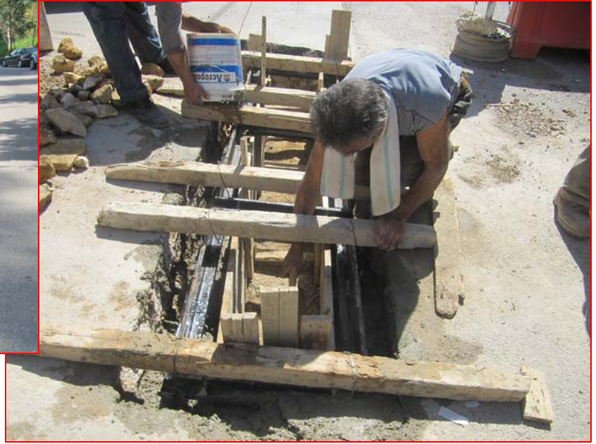
بوردير: حفر اساس - تركيب - تحميل - صب باطون خلف البوردير - بنك بيبيلوس