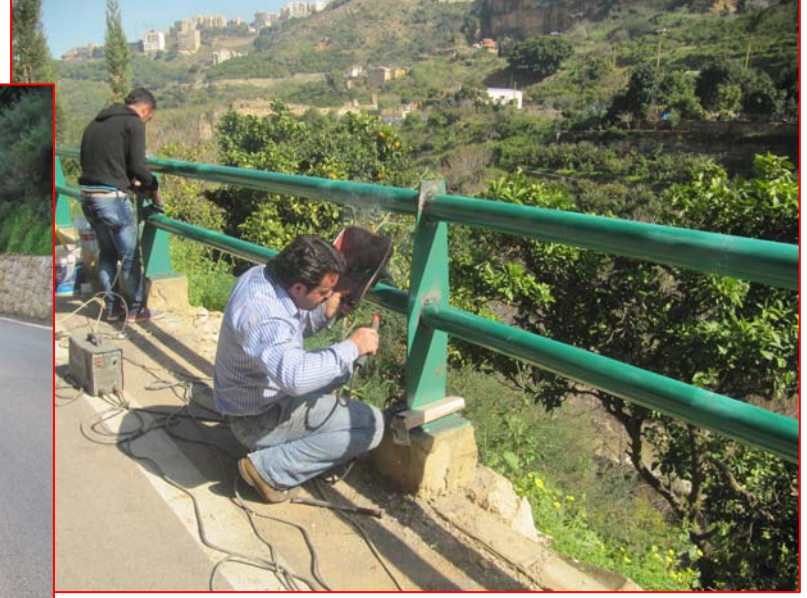
صيانة: الدرابزين الحديدي والبوردير على طريق قناطر زبيده - السد، وإعادة طلاء المتضرر منه