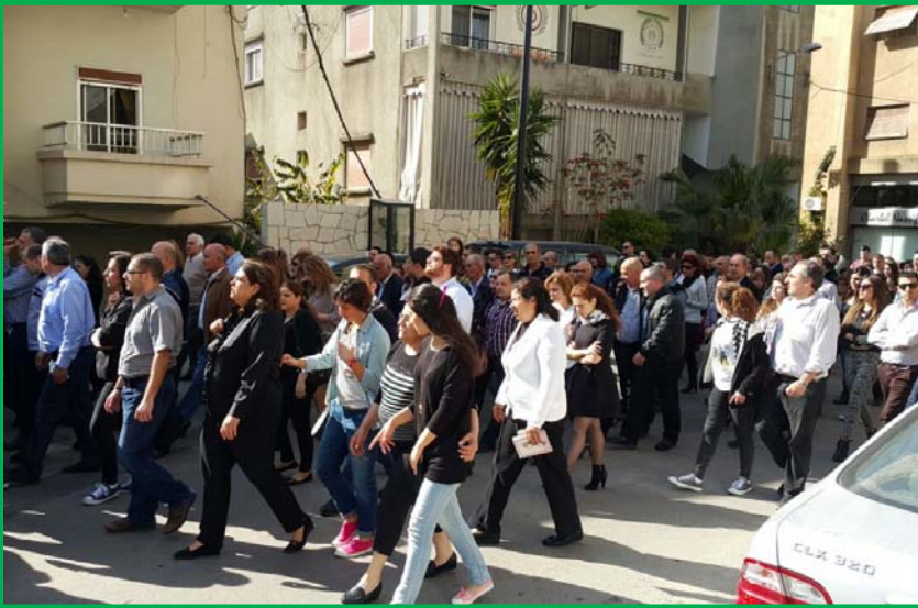
رعية مار روكس: غصت بمسيرات حاشدة للإحتفال بأحد الشعانين واسبوع الآلام