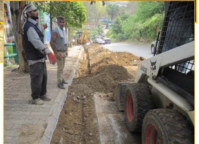
صيانة وتبديل: قساطل لتصريف مياه الأمطار، وتمديد قساطل جديدة مع ردم الحفرة والتزفيت واعادة الوضع الى ما كان عليه سابقاً