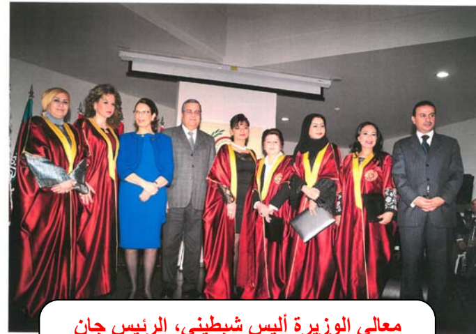
معالي الوزيرة أليس شبيطيني، الرئيس جان الاسمر والسيدة لينا مكرزل يتوسطون المكرمات من مختلف الدول العربية

" هي المرأة ... نصف المجتمع النابض بالعقل والمحبة ... هي مربية الأجيال ... هي الأم والأخت والمعلمة والصديقة ... هي مصدر الحكمة والإلهام وهي المزج بين دفتي الدماغ اليمنى واليسرى ... بدأت مسيرة نضالها منذ فجر التاريخ لتثبت دورها في مجتمع كان ظالماً لها في احدى الحقبات، ولا يزال في بعض البلدان. ليس بالكثير على المرأة تخصيص يوم لها، بل تستحق أكثر من ذلك، هي من تعطي من ذاتها طوال السنة.... "