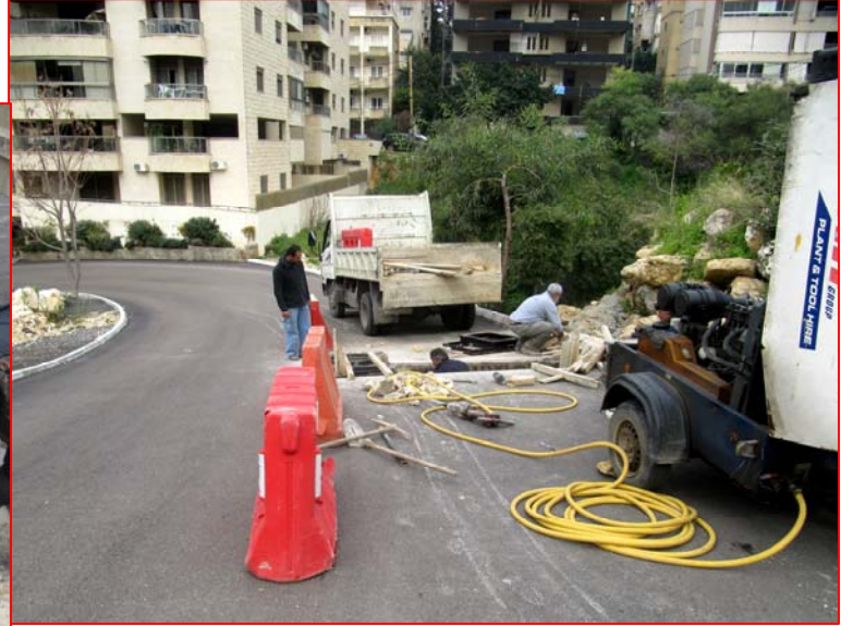
قطاعات: حفر وانشاء قطاعة لتصريف مياه الأمطار - جنب محطة جبور