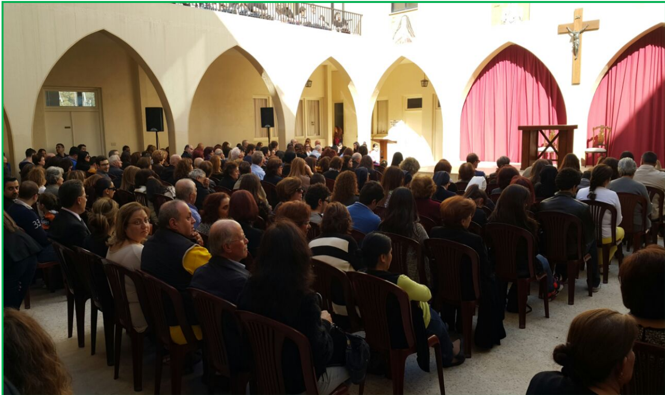
دير سيدة الكرمل في الحازمية: الخشوع في قداس الرهبان والإحساس الصادق بالعيد الكبير!