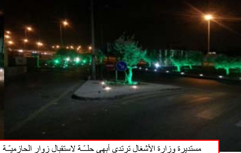
مستديرة وزارة الأشغال ترتدي أبهى حلّة لاستقبال زوار الحازمية ضمن خطة انارة وتجميل المستديرات