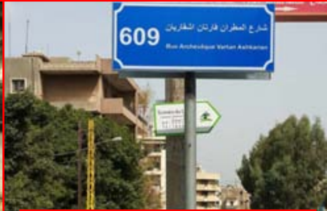
الشارع رقم /٦٠٩/ يتحصّر ليحمل اسم شارع المطران فارثان اشقاريان - ابن الحازمية - في احتفالية مميزة تقام يوم الجمعة ٢٧/١١/٢٠١٥