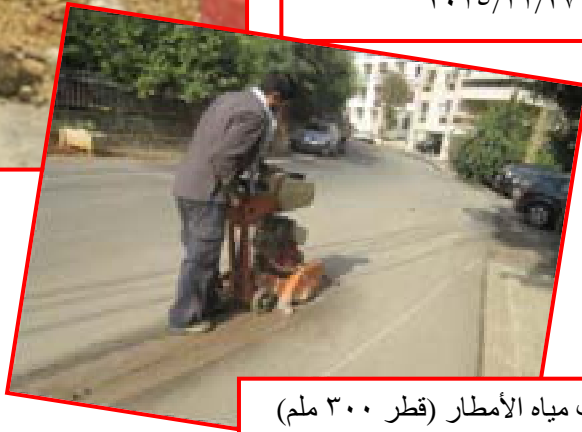
تمديد قساطل لتصريف مياه الأمطار (قطر ٣٠٠ ملم) مارت تقلا - شارع الوزير حبيقة * قرار المجلس البلدي رقم ٢٠٢/٢٠١٥