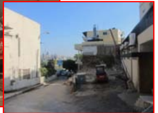
استمكت بلدية الحازمية العقار ١٣٦٠/الحازمية – بعبد العقارية (قرب كنيسة مار روكس) وقامت بهدمه تمهيداً لتحويله الى مواقف خاصة للكنيسة (التفاصيل كاملة في العدد القادم)