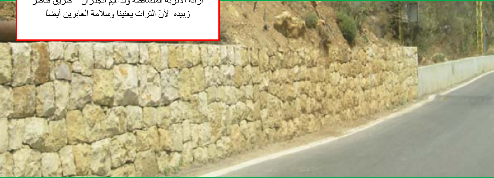
ازالة الأتربة المتساقطة وتدعيم الجدران - طريق قناطر زبيده لأن التراث يعنينا وسلامة العابرين أيضاً